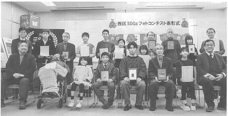
受賞者一同で記念写真

西野地区センターの恒 例行事である新春書き初 め展示会が今月10日、16 日、同センター1階ロビ ーで開かれた。 同センターでは先月20 日から今月7日まで作品 を募集していた。対象は 西野・福井・平和・宮の 沢・小別沢・西町・山の 手地区の小中学生で、今 年は約30点が寄せられ た。作品の大きさは半 紙・半壊紙など縦横100× 横25センチ以内。 書かれている文字は 「初日の空」「新年」など 正月にちなんだものを中 心とする。