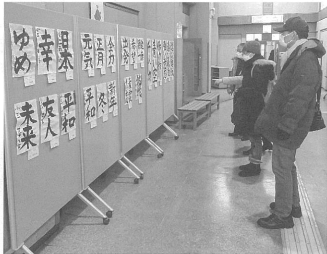
数々の作品に見入る

西区では令和2年から 毎年このコンテストを開 催し、SDGsを考えて 17の目標を意識するきつ かけとなる 写真を募集 している。 子どもから 大人まで幅 広い年齢層 を対象にし ており、今 回は64作品 が寄せられ た。写真の題 材を扱って