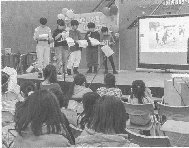
子どもたちが自身の環境活動を発表

「西区こども環境広場」が今年7日、札幌市生涯学習総合センター「ちえりあ」で行われ親子連れを中心に多くの人が来場した。主催は西区環境まちづくり協議会。同会は区内の連合町内会、学校、区役所などで「環境活動発表会」を開催。子ども会育成連合会西区支部、