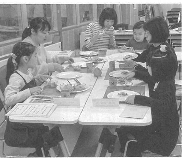
大賞レシピをもとにしたプロの料理を試食

このコンテストは子どもたちから野菜を身近に感じてもらう目的で、昨年度から始まった。西区在住か通学している小中高生を対象に野菜を使った