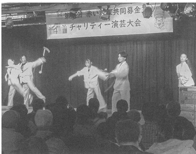
子どもたちによるバトンの披露も

出演者は西野児童会館「ハンドベルクラブ」、西区手稲区を中心に活動している「K.b.a.t.o