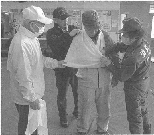
後半は様々な訓練をした

像を鑑賞して、恐ろしさを再確認した。最後に講師から「融雪時にも注意が必要」「日頃から定期的な周辺の状況把握を把握しておくことが重要」とアドバイスが