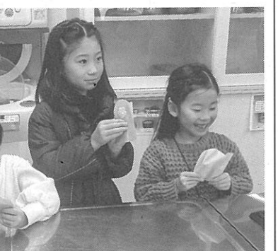
西区産りんごを使ったお菓子の試食もできた

福井野小ミニ児童会館、五天山自然観察クラブの3組が登壇し、行っている環境活動を写真を交えながら発表した。