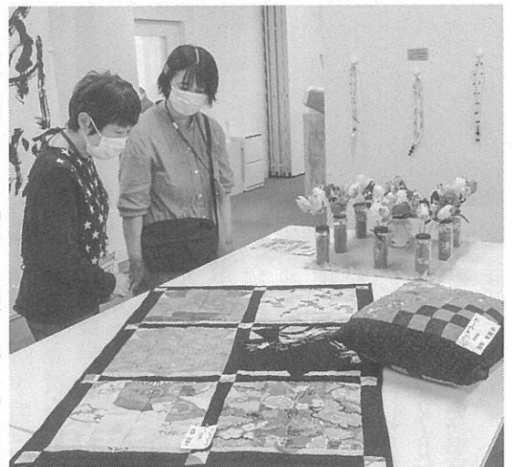
別室では作品が展示されていた

「第2次大戦中の家族描く」映画「キャロル・オプ・ザ・ベル」の上映会 映画「キャロル・オプ・ザ・ベル」家族の絆を奏でる詩」の上映会が12月7日(土)に開かれる。主催は札幌映画サークル。第2次大戦中のウクライナ、ポーランドを舞台にした映画。