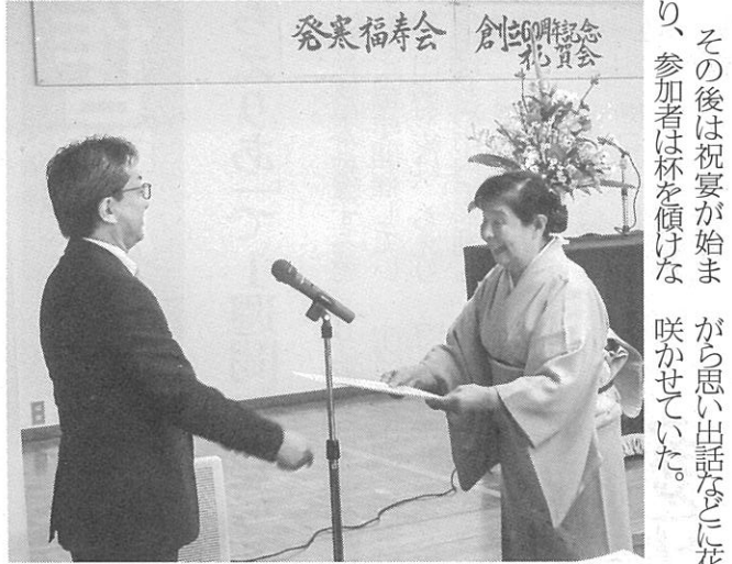
永年功労者が表彰された

拠点にして、例会やホフンティア活動、さらにはパークゴルフ・麻雀・茶道・歌の同好会活動を楽しんでいる。現在は約60人が所属し、活動を通して生きがいを見つけたり、会員同士の親睦を深めている。