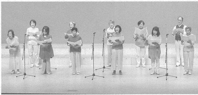
初日の音楽部門の発表の様子

5日から4日間行われた。初日は音楽部門、他は音楽部門、他の日は舞踊部門で、ハーモニカ、コーラス、フラダンス、3