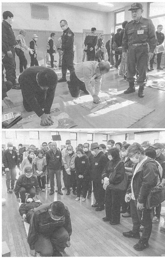
AEDを使った応急手当や簡易担架の組み立てを学んだ

地域の防災力を向上させる「西区防災実技研修」が今月2日、札幌市生涯学習総合センター「ちえりあ」で行われた。主催は西区。 地域防災力を向上させる「西区防災実技研修」が今月2日、札幌市生涯学習総合センター「ちえりあ」で行われた。主催は西区。