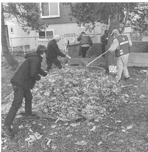
落ち葉を1か所に集める