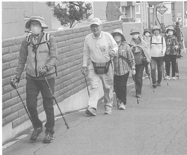
昭和会館から西野神社まで歩いた

西野地区健康講座が先月20日、昭和会館で開かれ約20人が参加した。この講座は西野・福井・平和・小別沢地区の住民を対象に、西保健センターと地元の連合町内会が主催している。内容を交えながら年度4回開いており、当日が今年度の1回目。