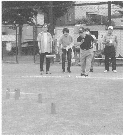
「スキットル」を目標けて投げる

「発寒ふれあいモルック体験会」が今月6日、発寒大空公園で行われた。主催は発寒体育振興会。モルックはフィンランド発祥のスポーツ。22・5センチほどの棒「モルック」を下手投げして、3センチほど先に並べた「スキットル」という木製のピンを倒すルール。