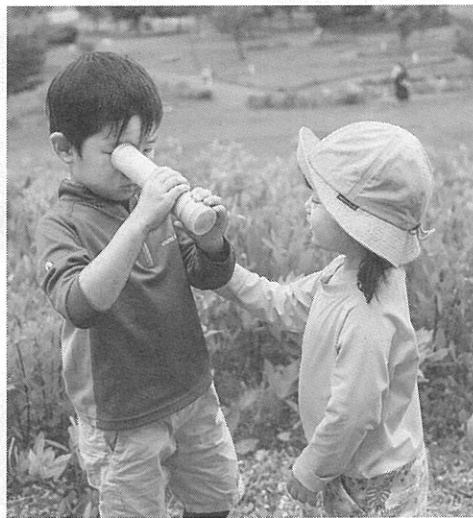
万華鏡を作ったよ

プログラムinSUMMERが先月27日、五天山公園で開かれ2〜3歳の子どもと保護者8組18人が参加した。主催は西区の町内会や学校、区役所などで構成されている「西区環境まちづくり協議会」(敬称略)。