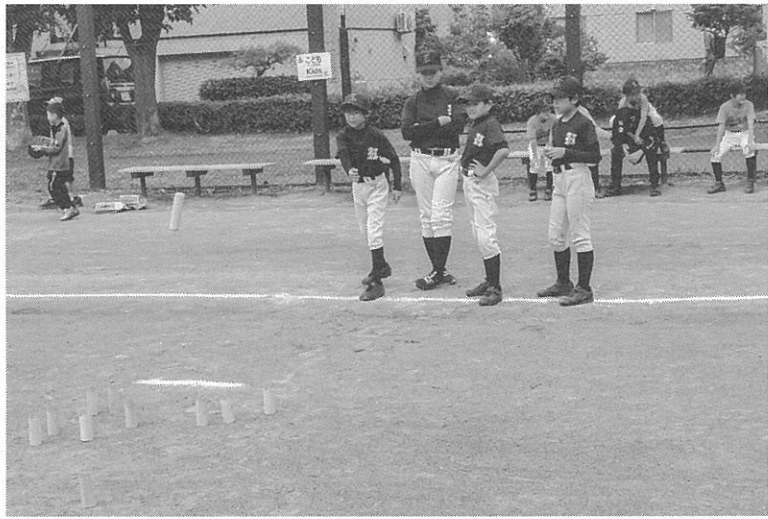
子どもたちも参加した

2チーム以上で対戦する競技で、スキットルに書かれている点数や倒れた本数で勝敗を決める。