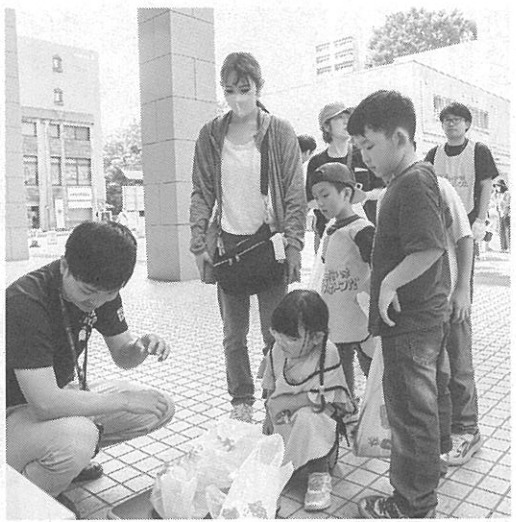
集めたゴミを計量

続いてポールを持つ姿勢に注意しながら歩き、さらにポールを引きずったりの地面に突いたりしながら歩いて、ノルディックウォーキングのコツをつかんでいった。その後は外に出て、昭和会館から西野神社までの道のりを往復した。参加者は姿勢や歩くペースについてアドバイスを受けながら、約4キロの道のりを歩いていた。